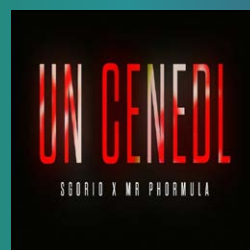
Un Cenedl – Mr Phormula