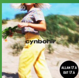
cynbohir – Gwilym