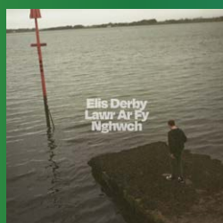
Lawr ar Fy Nghwch – Elis Derby