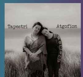
Atgofion – Tapestri